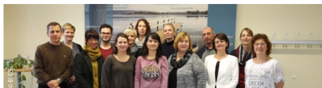
In ihrer ersten Versammlung verständigten sich die Mitglieder des BLGS-Landesverbands Brandenburg über zukünftige Arbeitsschwerpunkte.

Erste Aktion der Mitgliederversammlung war es, einen gemeinsamen Brief an die Verantwortlichen der Landesregierung zu schicken, um sie über unsere Aktivitäten zu informieren. Insbesondere wurden die Regierungsvertreter aufgefordert, sich aktiv für die Verabschiedung des neuen Pflegeberufereformgesetzes und die Durchsetzung der Generalistik einzusetzen. Positives Feedback kam vom Ministerpräsidenten, der Ministerin für Arbeit, Soziales, Gesundheit, Frauen und Familie und der Sprecherin für Sozial-, Gesundheits-, Pflege- und Seniorenpolitik der Fraktion Die Linke. Als besonders erfreulich hervorzuheben ist ein Gesprächsangebot des Ministerpräsidenten an den Landesverband.