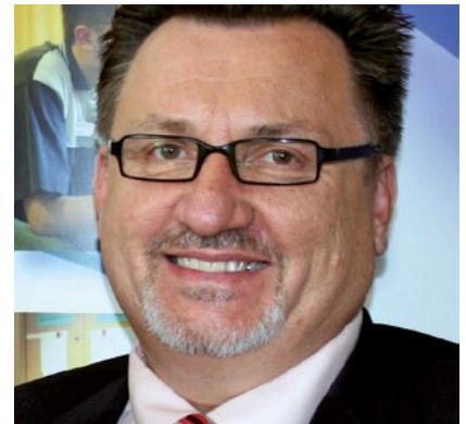
Franz Wagner, Vizepräsident des DPR und Bundesgeschäftsführer des DBfK.

Es braucht eine umfassende Initiative, die für deutlich bessere Arbeitsbedingungen sorgt. So könnten kurzfristig qualifizierte Pflegefachpersonen, die den Beruf wegen der Rahmenbedingungen verlassen haben, zurückgeholt werden.